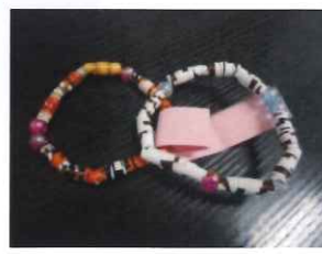
広告の紙を使ったフレズレット