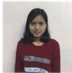
3階ユニット エイ・トゥー・ザー (エイさん)

とても明るく日本語も一生懸命勉強中です。施設の介護職員として頑張っていますのでよろしくお願いします！