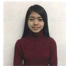
3階ユニット ス・ポ・ポ・アウン (ポ・ポさん)