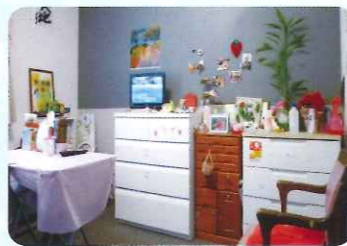
その人らしい居室へ