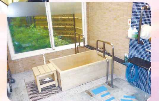
デイサービスの青森ヒバで造られた浴槽