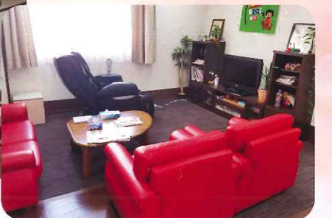
ショートステイ リビング