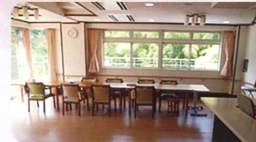
ショートステイ ダイニング